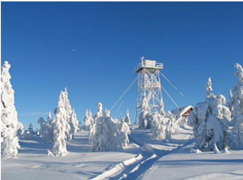
Blåenga i vinterdrakt.

Blåenga i Rud er et av få gjenværende brannvaktårn i regionen. Det ble bygd for at man i sommersesongen tidligst mulig kunne oppdage og varsle om skogbrann. Fra tårnet, som ligger 633 m.o.h., er det vidt utsyn til store deler av midt fylket. Hytta og et tårn i trekonstruksjon, ble bygd på 1930-tallet. Det gamle tårnet er senere erstattet av tårnet i stål, som fortsatt står der i dag. Anlegget består av tårn, vokterhytte og utedo.