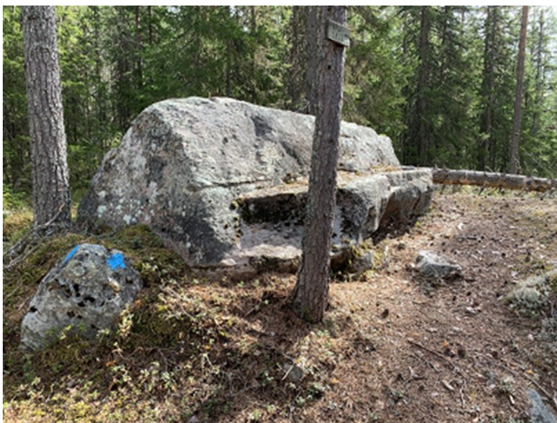
Brursæte ved Holtsjøen

Tilflytting er et ønske og mål i Våler. I den sammenheng er det viktig med formidling av kunnskap og historie. På den måten kan man oppnå at det skapes en styrket tilhørighet og identitet. Identitetsfølelsen til stedet der en bor er ofte knyttet til en bygning eller et anlegg. Disse kan være relativt anonyme. Først den dagen bygningene er revet, merker man den faktiske betydningen for stedets identitet. At en føler sterk tilknytning til stedet eller bygda er viktig, og er et viktig bidrag med tanke på å ta vare på kulturminnene. Våler har mange kulturminner som gir oss kunnskap og opplevelser. Flere av disse har høy verneverdi, som for eksempel den skogfinske kulturarven som også er av internasjonal interesse.