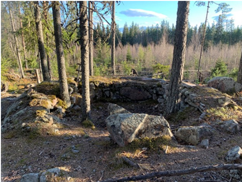
Stilling med Litauisk minne, Haslemoen.