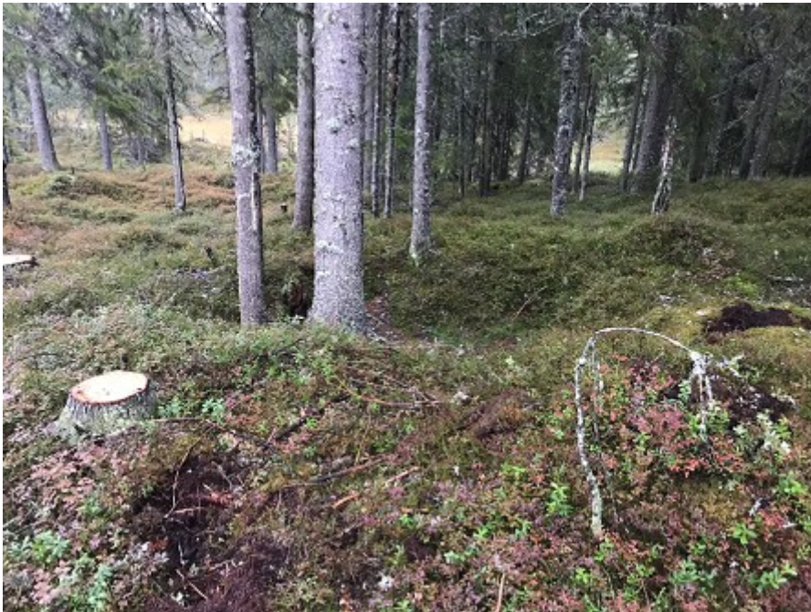
Kullgrop. Automatisk fredet.