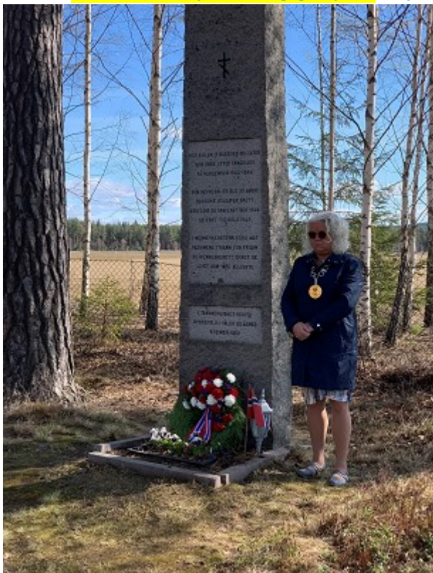
Ordfører Sæterdalen nedlegger krans 8.mai 2022

Under 2.verdenskrig bygde tyskerne flyplass på Haslemoen. Store deler av det tunge arbeidet ble utført av sovjetiske krigsfanger som tyskerne tok til fange ved østfronten. Fangeleiren fikk navn etter leirkommandanten og ble kalt Lager Wagner. Her holdt tyskerne 3-500 sovjetiske fanger. De levde under svært uverdige forhold med dårlig behandling, sykdom og sult. Det finnes mange eksempler på at lokale personer vågde seg til å gi dem en matbit. Mange av disse fikk som takk, små gjenstander som fangene hadde laget.