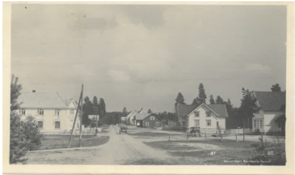
Parti ved Braskereid st.