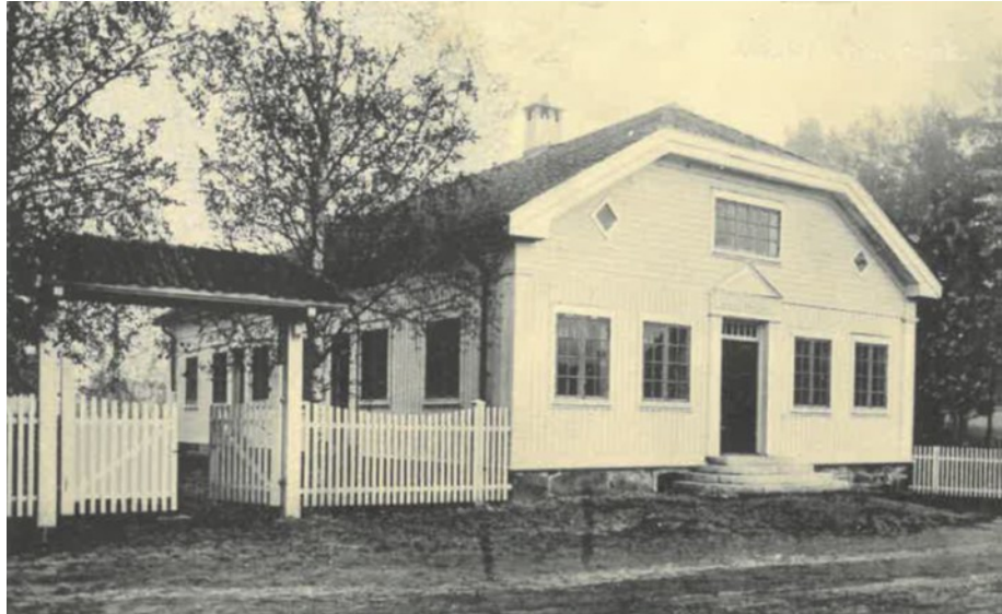
Vaaler sparebank. Vålbyen. Ca. 1911