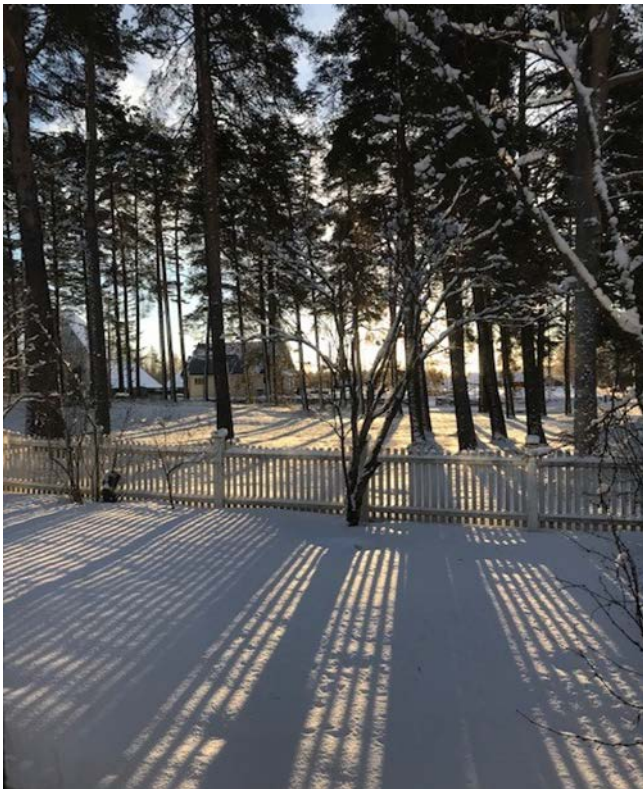
Sjursenparken m/Våler kapell, Vålbyen.

I Våler kommunes forslag til reguleringsplan for Haslemoen ligger det forslag til hensynssoner for kulturminner.