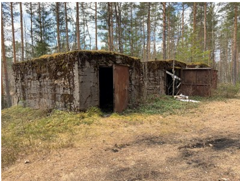
Kullbrenningssovner ved Høgvelta, Kynna.