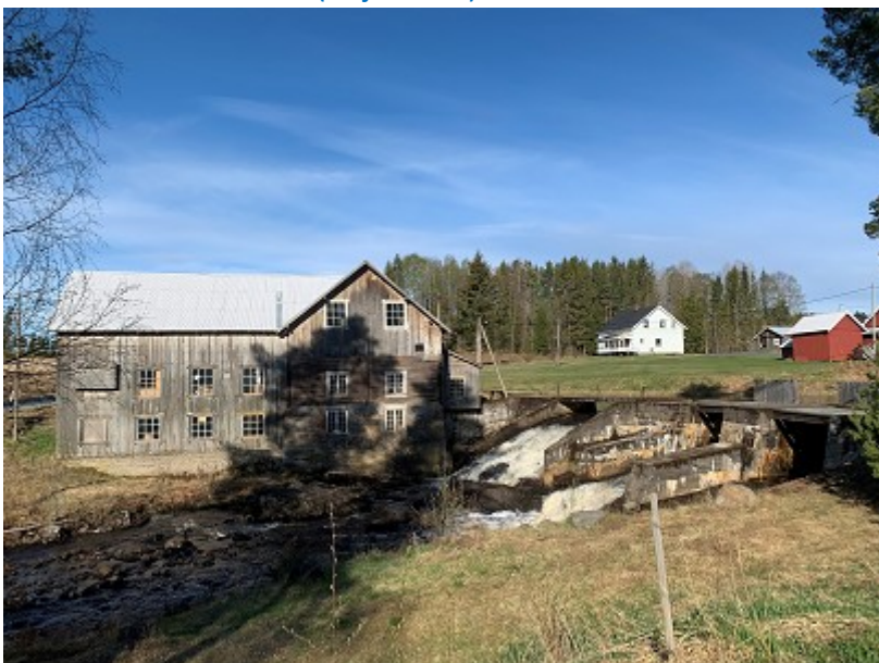
Tøråsen mølle med damanlegg.