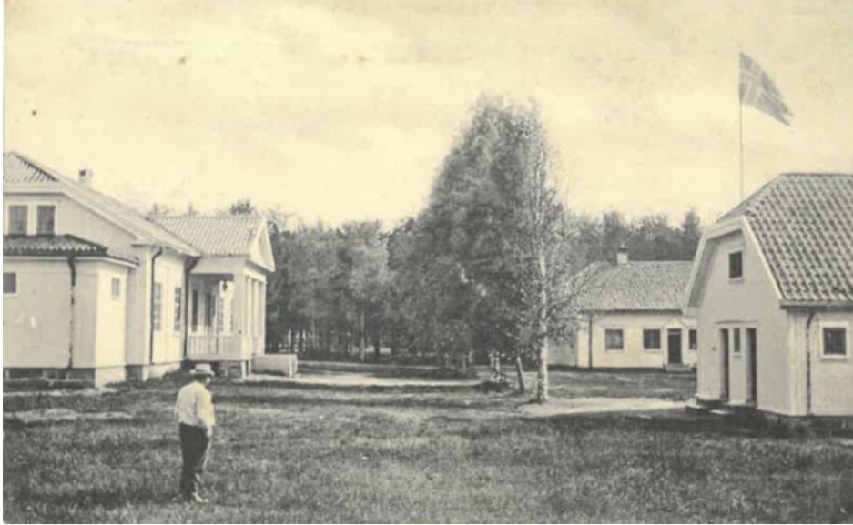
Kommunelokalet med sidebygninger. Vålbyen. Utgiver: Alfarheim Boghandel

I 1894 oppføres et eget kommunelokale på tunet, nordøst for den eksisterende gamle hovedbygningen. Som den andre bygningen på tunet var også denne oppført i upanelt tømmer med saltak og en veranda i sveitserstil. Bygningen var enkel i sin karakter, både innvendig og utvendig, men kommunelokalet på Kirkenær kom til å spille en viktig rolle i datidens kulturliv og den gjør det fortsatt i dag. En av de største og viktigste begivenhetene som fant sted var den store folkefesten foran kommunelokalet 7.juni 1906 som markerte årsdagen for unionsoppløsningen med Sverige.