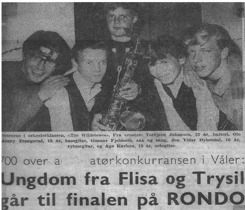
700 tilskuere i kommunelokalet, 1960-tallet.