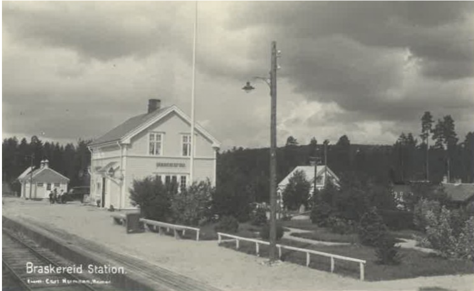
Braskereid station. Braskereidfoss.