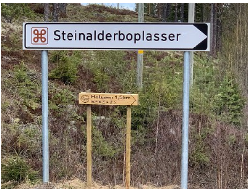
Anvisning til steinalderboplass ved Holsjøen, Kynna.

Lokalitetene er sårbare og det er nødvendig med varsom tilrettelegging.