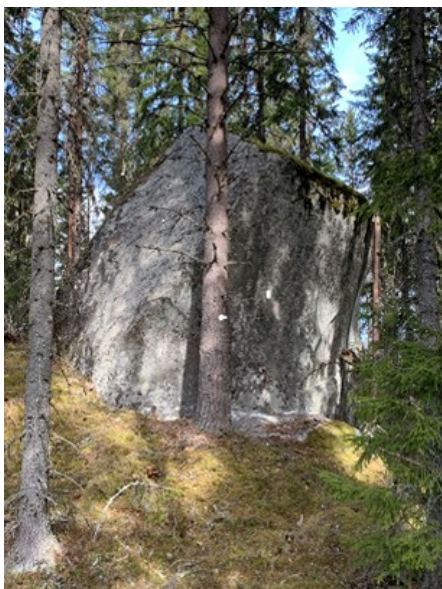
Ringstein, Tøråsen.

Styrket håndverkkompetanse og økt bevissthet blant arkitekter og eiere. Ved restaurering av den eldre bygningsmassen med kulturhistorisk verdi kreves god kjennskap til både materialbruk og håndverksteknikker. Det er en mangelvare i vårt område. For å møte de utfordringene som ligger foran oss, har vi behov for flinke håndverkere med kunnskap om restaurering. I den sammenheng bør handlingsbåren kunnskap styrkes. Det er mange av kulturminnene i våre som trenger spesiell kompetanse ved ivaretagelsen av dem. Per i dag er mange av de håndverkere som utfører vedlikehold og restaurering av våre viktige kulturminner fra andre deler av landet og ikke fra vår region. Vi mener at håndverksmiljøet bør styrkes og ved at kommunen stimulerer til samfinansiering av restaureringsprosjekter.