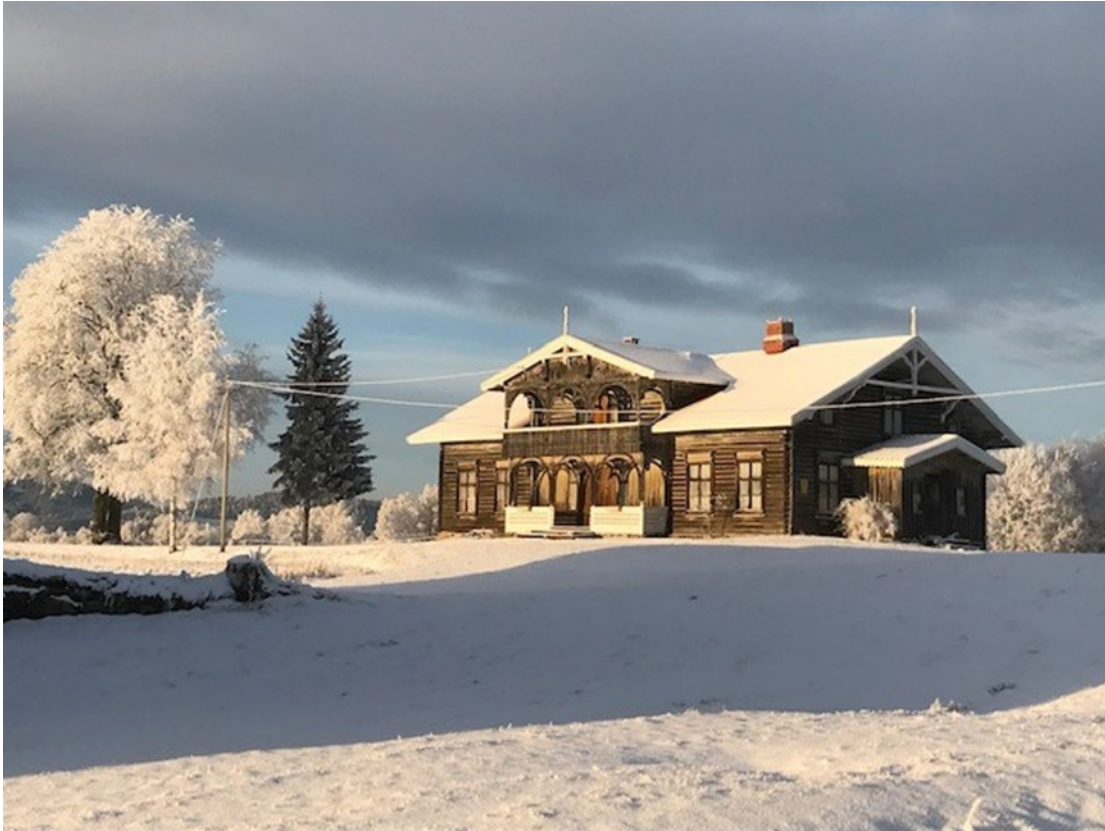
Lunden Gård, Braskereidfoss.