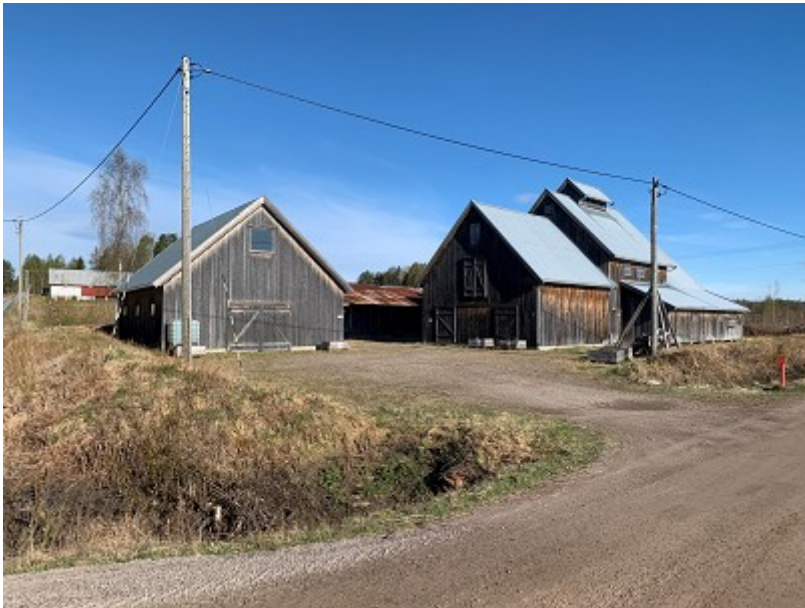
Våler torvdriftsmuseum, Stræte.