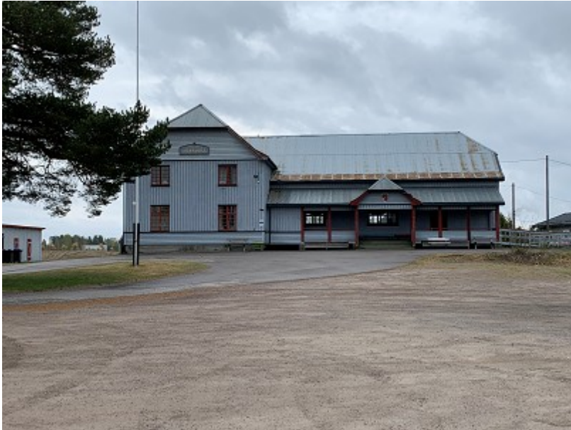
Vidarvoll mai 2022.