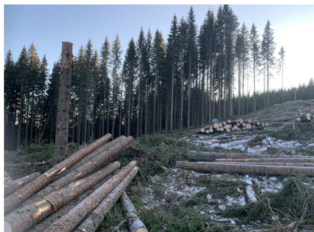
Tabell 9: Avvirkning i Våler, siste 8 år

Det avvirkes årlig ganske jevnt i både Våler og Åsnes. Planavdelingen i Glommen Mjøsen skog har beregnet at det i Åsnes avvirkes ca 85% av tilveksten mens det i Våler avvirkes ca 90% av tilveksten.