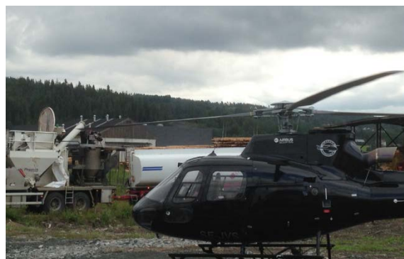
Tabell 8: Gjødsling av skog i Våler og Åsnes de siste 8 år.

Tilskudd til skogsgjødsling ble innført i 2016. Skogbruket i Våler og Åsnes har respondert godt på innføringen av tilskuddet. Gjødsling av skog vil normalt øke den årlige produksjonen på arealet med ca. 0,15 m 3 /dekar i 6-8 år framover. Det gis fra 2022 50 % tilskudd til gjødsling. Det må foreligge regning/faktura som dokumenterer utført gjødsling. Areal/bonitet, gjødselmengde og vegetasjonstype pr. felt må oppgis sammen med kartutsnitt som viser beliggenheten av det aktuelle feltet. Frist for å levere søknad til kommunen er 15. september .