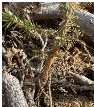
Bilde: Plante med gnageskader

Året etter at det er plantet, er det viktig å gå over plantefeltene for å se hvordan tilslaget har blitt. Det gis tilskudd til suppleringsplanting i etablerte plantefelt og naturlig foryngelse med for lav tetthet slik at produksjonsmuligheten utnyttes. Det gis 30 % tilskudd til suppleringsplanting uavhengig av hvor mange planter som suppleres inn. Det er krav om at plantetettheten etter supplering tilfredsstillende fastsatte minimumstallet pr. dekar ved tettere nyplanting (se tabell 4 over – «Minimum plantetall pr. dekar»). Utviklingsdyktige planter av ønsket treslag med en innbyrdes avstand på minst 1 m som vil inngå i framtidsbestanden kan telles med når plantetetthet etter supplering vurderes.