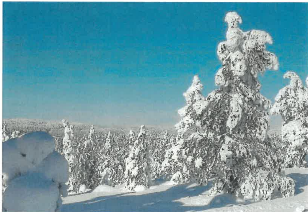
Vestmarka – snøtung skog

Eiendommen er fordelt på teiger beliggende både på østsiden og vestsiden av Glomma. Sammenhengende enheter på østsiden av Glomma er Bølsjø skog i Risberget, Kynndalsmoen/Åkerberget, Eidsberget, Heberget, Tannlia, Flatåsen, Sørsåsen, Øverbyåsen og Haslemoen skog. På vestsiden er Sjurderud, Svennebysetra, Gjerdrum og Nordenberg skog de største enhetene.